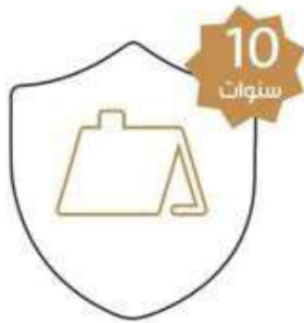
العزل للأسطح الخارجية