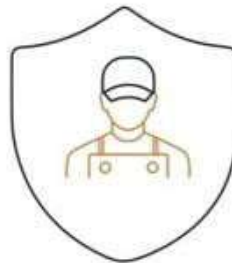
إشراف هندسي على كامل المشروع