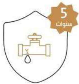
عزل دورات العياه